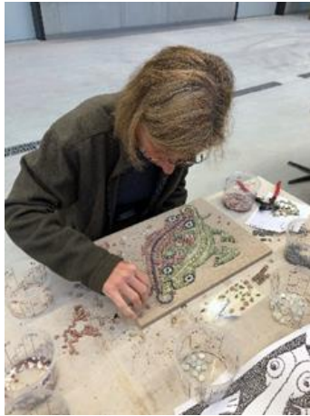
Eine Kursteilnehmerin vom Mosaik-Kurs während der Arbeit