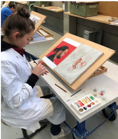
Eine Kursteilnehmerin vom Fresko-Kurs während der Arbeit