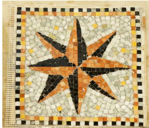
Die Arbeit eines Teilnehmers während des Mosaik-Kurses